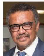
Tedros Adhanom Ghebreyesus