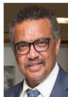
Tedros Adhanom Ghebreyesus